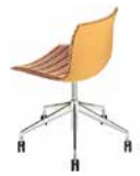
5 razze girevole 5 ways swivel fünfstrahliges Fußkreuz, drehbar 5 radios giratorios 5 branches pivotantes 回転機能付5本脚 5向台座