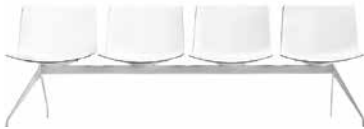
Panca Bench Sitzbank Banco Banquette ベンチ 长凳