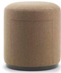
MONOCOLOR / MONOCHROME / EINFARBIG / UNICOLORE