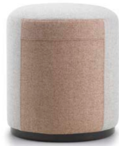
BICOLOR / TWO-TONE / ZWEIFARBIG / BICOLORE